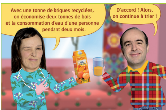
Illustration: Christophe A. Bouché